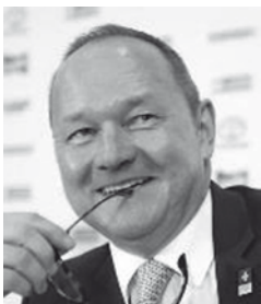
Nationalrat Jürg Stahl

Eine Vielzahl grosszügiger Sponsoren, Inserenten und Gönner ermöglicht uns die erfolgreiche Durchführung des RTF 2018. Als Gegenleistung unternehmen wir alles, um unseren kulantesten Unterstützern eine möglichst optimale Werbepattform für ihre Dienstleistungen und Produkte zu bieten. Dies gelingt uns unter anderem deshalb, weil wir auf drei prominente und bekannte Persönlichkeiten zählen dürfen, die uneigennützig als Botschafterinnen und Botschafter für das RTF 2018 eintreten und sich für unser Turnfest in der Öffentlichkeit einsetzen.